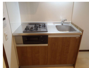
2口コンロの便利なキッチン