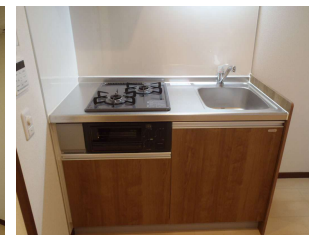
2口コンロの便利なキッチン