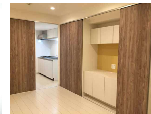
収納スペースにはデスクもあります