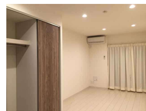
エアコン・カーテン付です