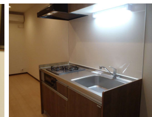
2口コンロの便利なキッチン