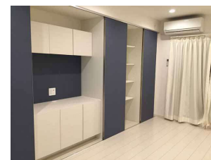
収納スペースにはデスクもあります