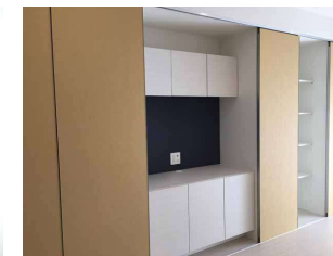
収納スペースにはデスクもあります