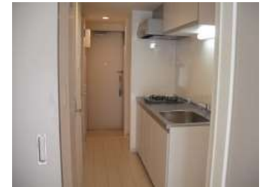
使いやすいキッチン