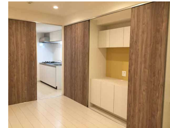
落ち着いた木目調のクローゼット