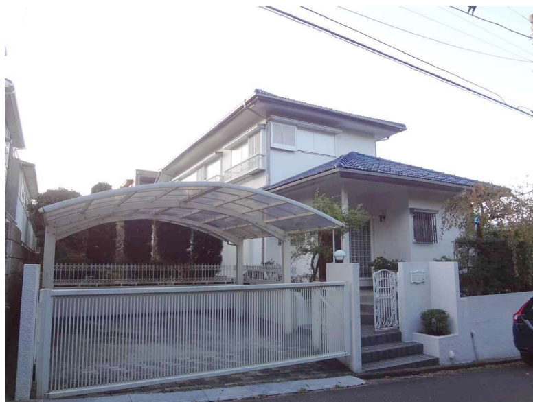
外観 陽当り良好です