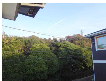
2階ベランダより東南側の景観