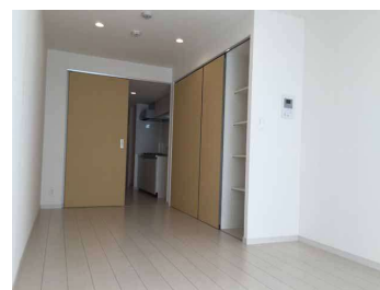
108: ナチュラルベージュの扉