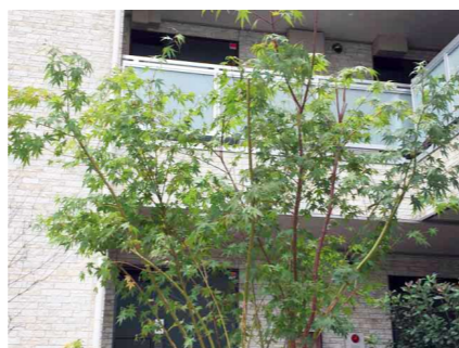
豊かな植栽が高級感を演出