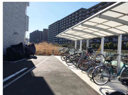
屋根付きで整然とした駐輪場