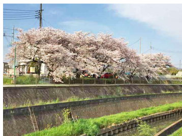
目の前を流れる川沿いの桜