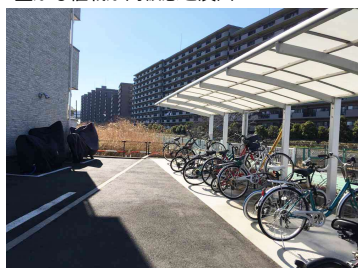
屋根付きで整然とした駐輪場