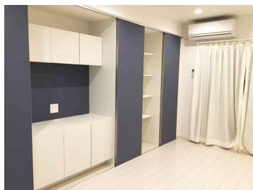
大容量の収納が女性に人気