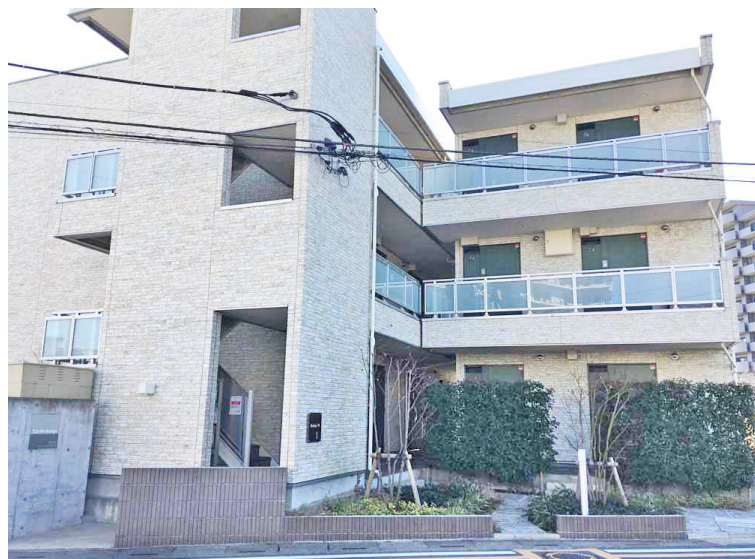
平成31年3月撮影 新築時からの外観の劣化は感じられません