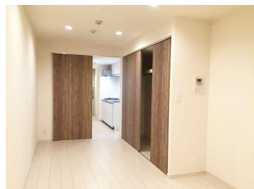
収納扉のクロスは各階で色違い