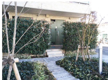
豊かな植栽が高級感を演出