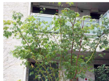
鮮やかなシンボルツリー