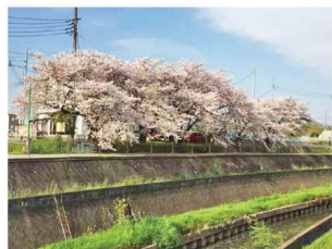
目の前を流れる川沿いの桜