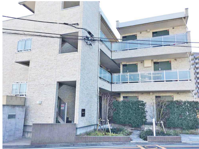
平成31年3月撮影 新築時からの外観の劣化は感じられません