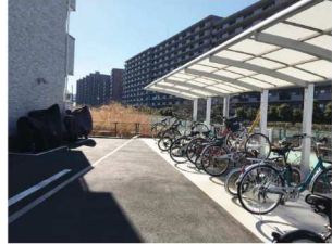
屋根付きで整然とした駐輪場