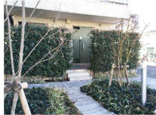
豊かな植栽が高級感を演出