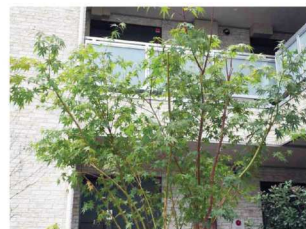
鮮やかなシンボルツリー